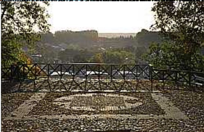
Przejść przez walec z kamieniami. Poniżej: Huty w Opatowie. Elementy dziedzictwa kulturowego