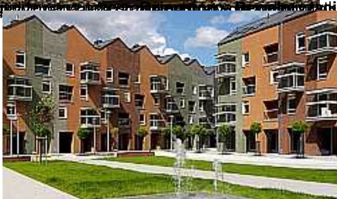
Reanowacja kamienicy w Opatowie. Zespół zabudowy śródmiejskiej z ważną dla tworzenia