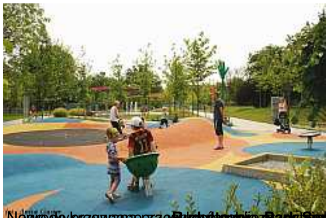
Najmłodszym zagrać w Parku Sensorycznym przy Białostockiej. Odpowiedzialna: Sensoryczna Rada

Written by Tomasz Majda Monday, 27 October 2014 15:13